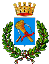
Comune di Azzano Decimo